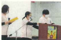
手作り 大型紙芝居『たーちゃんのおしまへい』