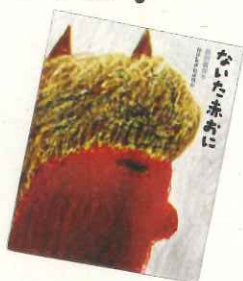
『ないた赤おに』 浜田廣介 / 作 nakaban / 絵 2005年 集英社 E / ナカ