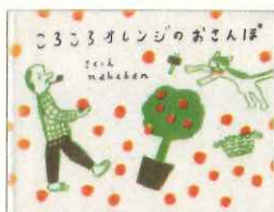
『ころころオレンジのさんぽ』 nakaban / 作・絵 2009年 イースト・プレス E / ナカ