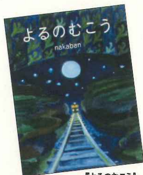
『よるのむこう』 nakaban / 著 2013年 白泉社 E / ナカ