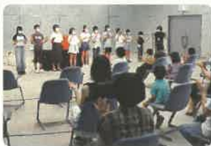
よみかせたい」による すいかのめいさんち〜♪