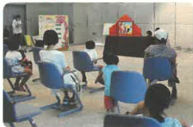
よみかせたい」による 大型かみしばい「したきりすずめ」 「したきりすずめのおやどはどこじゃ？」