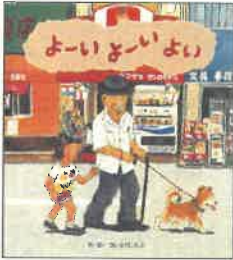
『よーい よーい よーい』 2009年 ひさかたチャイルド E/サイ