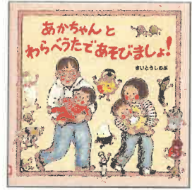
『あかちゃんと わらべうたであそびましょ!』 2020年 のら書店 E/サイ