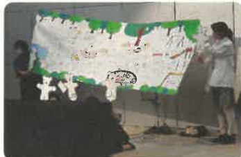
伝々虫による ペープサート 「うれしいさんかなしいさん」 パネルシアター 「すてきなぼうし屋さん」