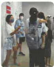
受付の仕事も慣れてきました。