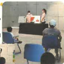
高松大学による 大型絵本 「ありとすいか」