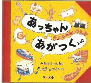
『あっちゃんあがつく』 2001年 リーブル E/サイ