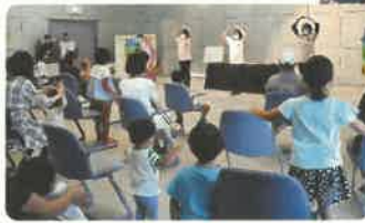
ことばとふりつけがたのしかったね！