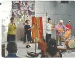
わいてくるくるおんがっかい ロバの音楽座 ホールが楽しい音楽でいっぱい♪