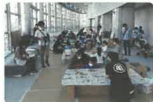
伝承手づくりおもちゃ たくさんあそべるおもちゃをつくったね