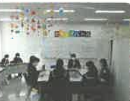
中学生ビブリオバトル 予選・本選 白熱した勝負だったね