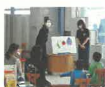
おはなし会 いろんなおはなしありました