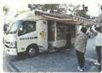
移動図書館ララ号