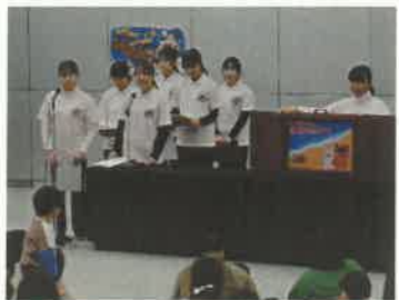
高松大学読み聞かせ隊