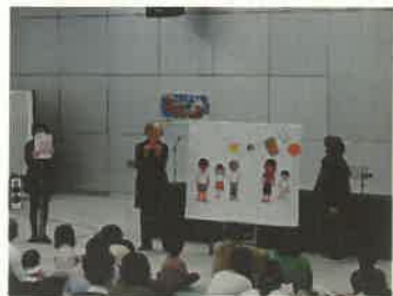
高松こどもの本の会