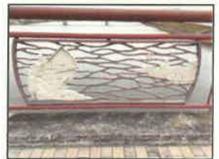
欄干にはレリーフも