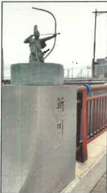
弓を引く那須与一の像

県道155号牟礼中新線にある新川橋。この橋には、『平家物語』や『源平盛衰記』に書かれている「扇の的」のエピソードで有名な、那須与一（生没年不詳）の像が立っています。