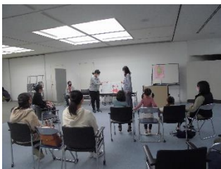
図書館でのおはなし会